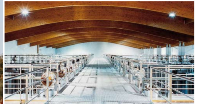
State of the Art der Kellertechnik bei Riscal