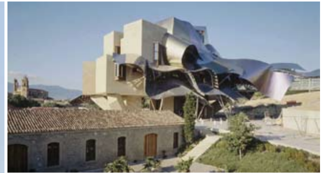
Stararchitekt Frank Gehry's Hotel für Marques de Riscal