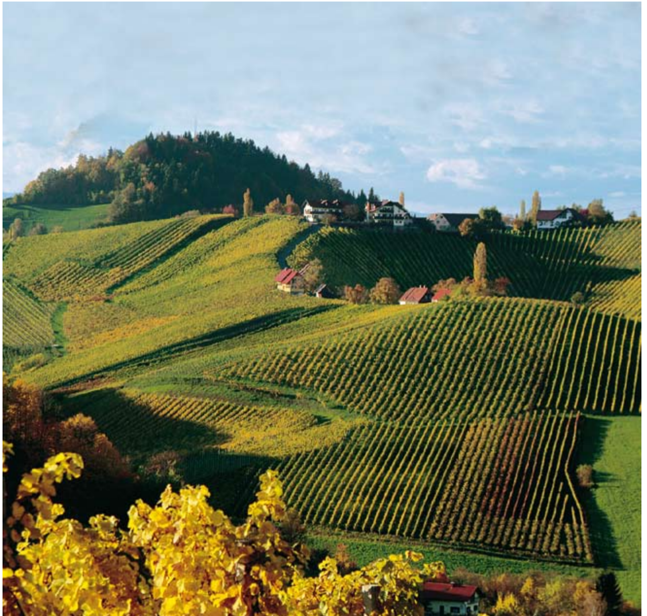
Dem Himmel so nah: Der Hochstermetzberg in Ratsch an der Weinstraße. Die Kessellage im Hintergrund ist die Ried Schusterberg.