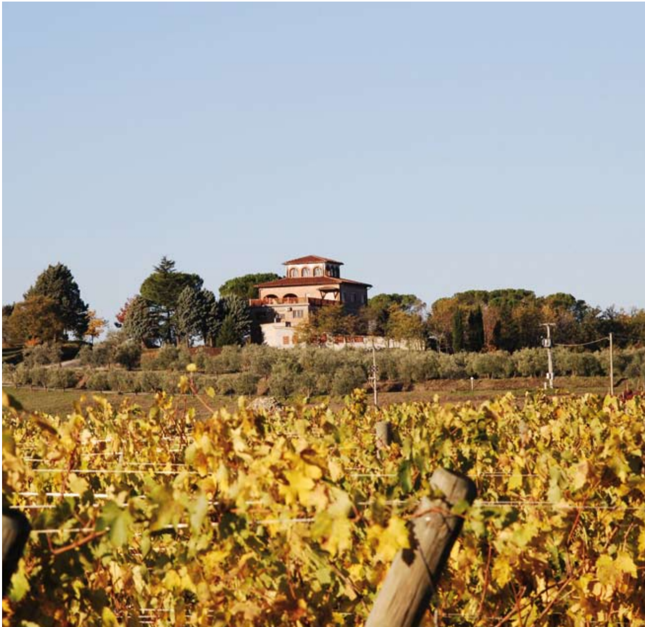
Auf Villa Trasqua werden neben Sangiovese auch Ciliegolo, Colorino, Malvasia nera und Lanaiolo bestens gepflegt