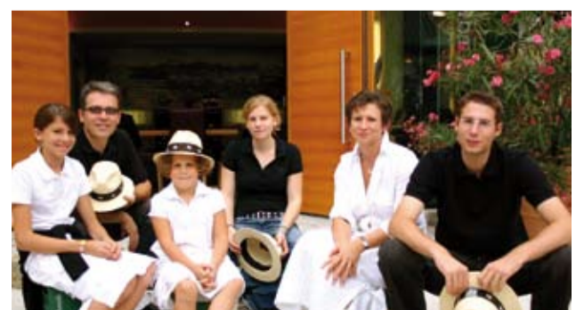
Die Hofbauers: eine Familie für den Wein