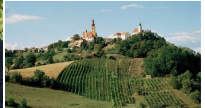
Die Riede Steintal in Straden